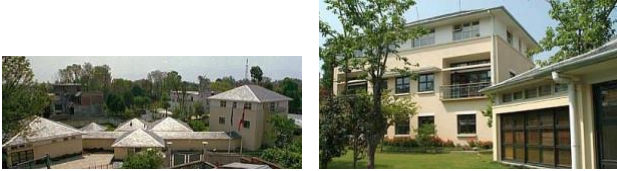
■デンマーク大使館