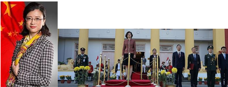
(在ネ中国大使館 HP より)