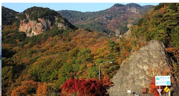
■天使的散歩道(蛭子神社～大余島)／寒霞溪