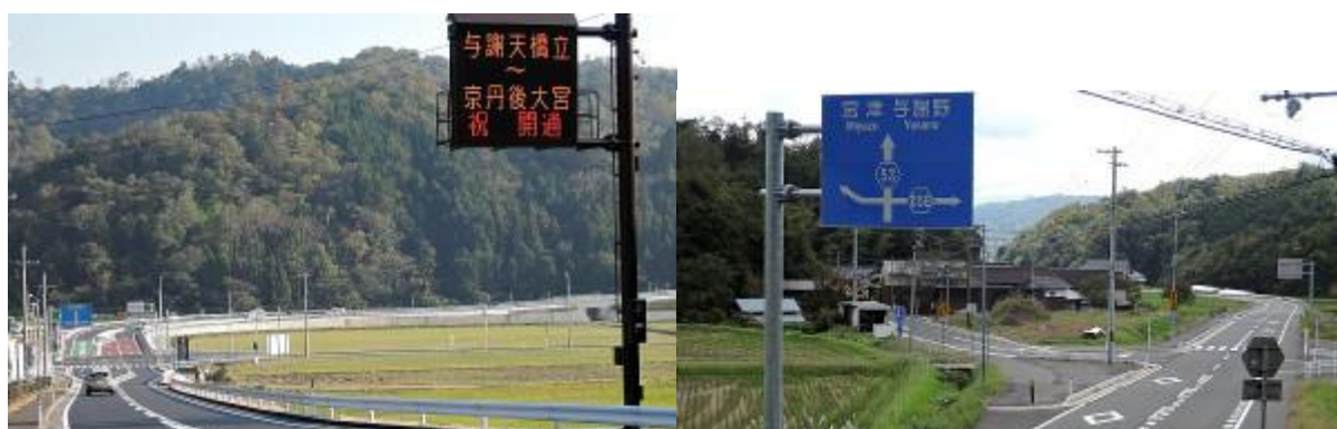
■完成したインター出口／数キロ先の新設「久住バイパス」

また、米軍の軍人・軍属の皆さんの車利用も大歓迎。高速道路のこの付近の制限時速は 70km(!)だし、取り付け道路にはまだ曲がりくねった狭い旧道もあちこちにあるが、これもどうということはない。住民自身がよく注意しておれば、それで済むことだから。