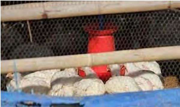
■近郊の鶏舎(今回の鳥インフルとは無関係)