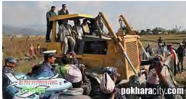
■ポカラ国際空港フェイスブック