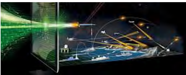
■レイセオンのハイテク戦争ビジネス(Raytheon)

レイセオン社は世界最大のミサイルメーカー。2012 年度の売上 240 億ドル、従業員 6 万 8 千。