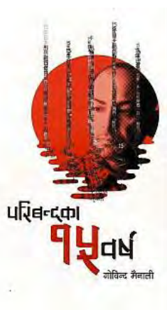
■ Paribandaka 15 Barsha , Pairavi Book, 2013

日記は大学ノート18冊にも及ぶというから、本書に訳出されたのは、その一部にすぎない。十数年の長きにわたって、日常と化した獄中生活を倦むことなく記述し続けてきたマイナリ氏の忍耐と、それを育成したネパール式教育に敬意を表したい。