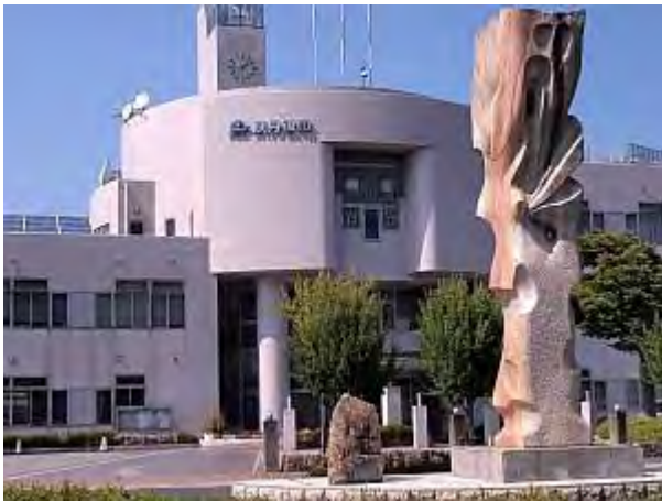
■豪華な京丹後市庁舎

府知事と市議会への説明後、8 月 7 日に開催された地元住民説明会(宇川小学校)では、本音もチラリ。「安全安心が確保されるなら、必要な協力をするのが道理」(京都 8 月 8 日)。「日本の国民の一員として国防を考えねばならない」(毎日 8 月 8 日)。「日米安保条約が大切だと考えている」(同上)。