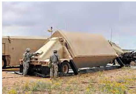
■ミサイル防衛システム／TPY-2 レーダー(Raytheon)