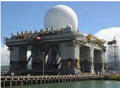
■米軍 X バンドレーダー(US Navy HP)

人権と民主主義の原則に立つなら、臆せず、断固こう主張すべきだ。「 地方の問題を国家として尊重する 」