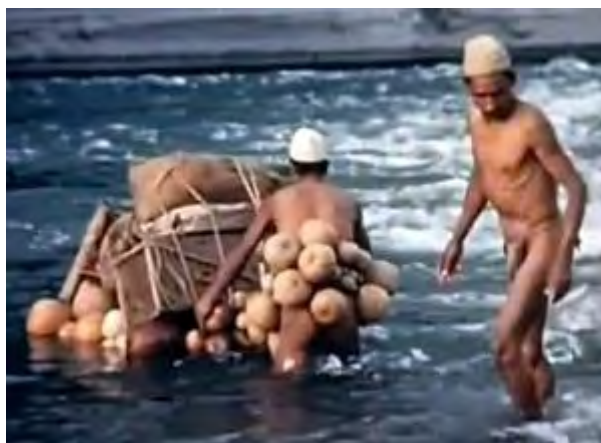
■化膿を切開治療／ウキをつけ荷渡し