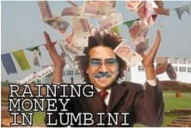
ルンビニのプラチャンダ議長