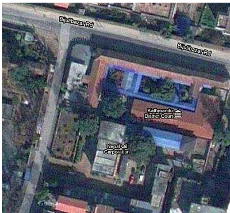
■ネパール石油公社(下), カトマンズ郡裁判所(上) [Google]

不況下の物価上昇は、日本のような先進国よりもむしろネパールのような途上国にとって、より深刻な事態をもたらすだろう。