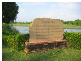
ルンビニの五戒碑(2008.9)