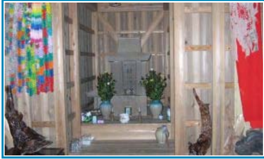
祭神サンジワン様