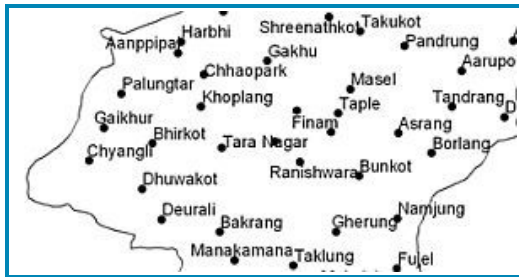
ゴルカ郡パルンタール付近

マオイスト第6回拡大中央委員会(Plenum)が11月21日、ゴルカのパルンタールではじまった。25日までの予定。