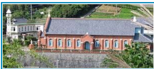
黒崎教会 (枯松神社側より)

それやこれやで、枯松神社祭の秘教的厳肅さは、結局、失われざるをえないだろう。残念なことだが。