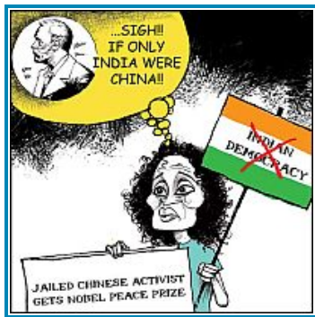
Outlook India, Nov.10

告発者たちは、このロイ発言がインド刑法(IPC)124A,153A,153B,500にあたるとして、FIR(First Information Report)により告発していたのだ。